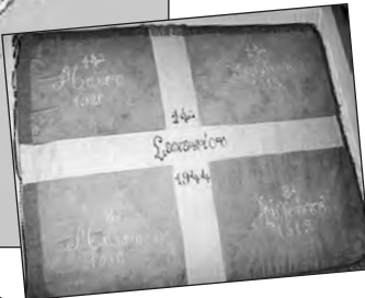
Η Ιστορική σημαία της Κομοτηνής

να θυμίζουν σε όλους τις ρίζες τους και τις Πατρίδες στον Πόντο που έχουν χαθεί, αλλά όπως έχει δηλώσει ένας Μεγάλος Έλληνας, ο Μακαριστός Αρχιεπίσκοπος Χριστόδουλος: